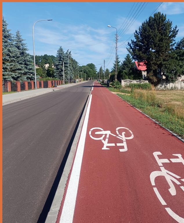
ul. Zawodzie w Wojkowicach Kościelnych