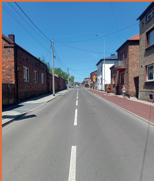
ul. Piłsudskiego w Siewierzu

Przy tej okazji zwracamy się z prośbą o poszanowanie efektów wykonanych prac i nieparkowanie samochodów na ścieżkach rowerowych tylko w miejscach do tego celu wyznaczonych. Wszystkim mieszkańcom dziękujemy za cierpliwość i wyrozumiałość, którymi wykazali się w czasie prowadzenia działań budowlanych i remontowych.