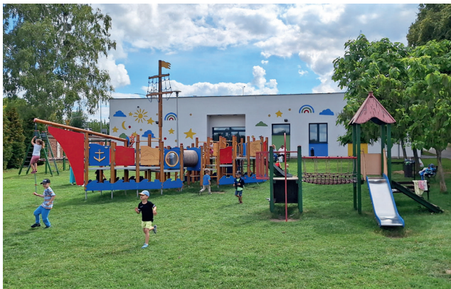
Budowa żłobka zrealizowana z udziałem środków z KPO

Budynek został przystosowany do opieki nad 24 maluchami w wieku 1-3 lata. Jest w pełni dostępny dla osób z niepełnosprawnościami. Jest to już drugi publiczny żłobek w naszej gminie. Stwarza on młodym rodzicom możliwości połączenia pracy z życiem osobistym i powrót do aktywności zawodowej w terminie, który uznają za optymalny. Wysokość dofinansowania w ramach programu Aktywny Maluch 2022–2029 ze środków KPO wyniosła niemal 1,4 miliona złotych, a ze środków z budżetu państwa pochodzących z podatku VAT 317 tysięcy złotych. Łącznie dało kwotę prawie 1,7 miliona złotych wsparcia.