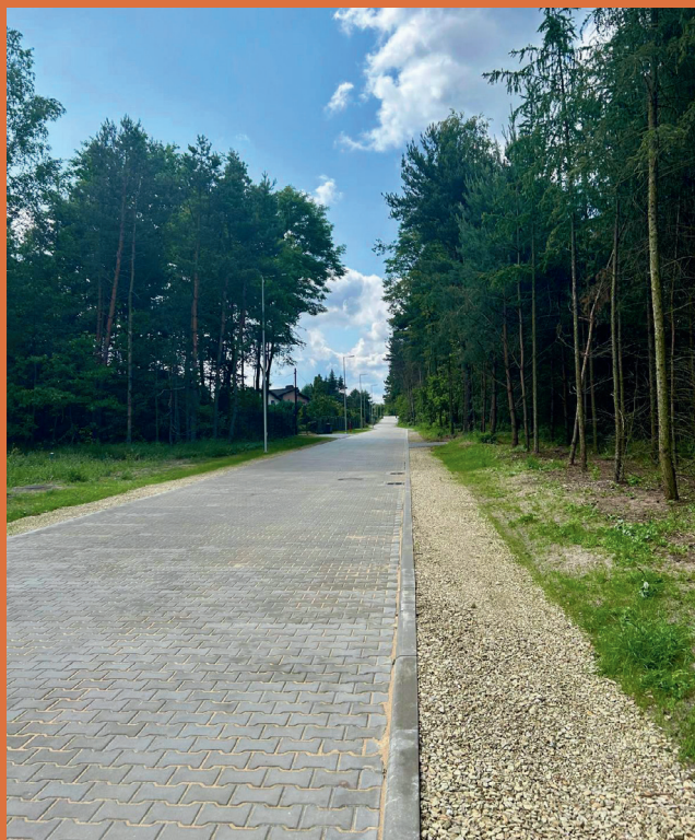
droga boczna od ul. Karsów w Wojkowicach Kościelnych