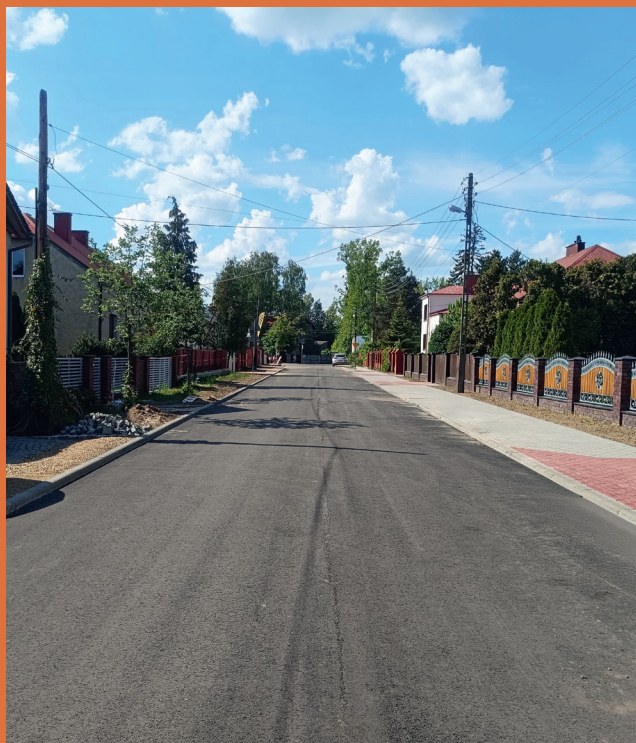
ul. Żeromskiego w Siewierzu