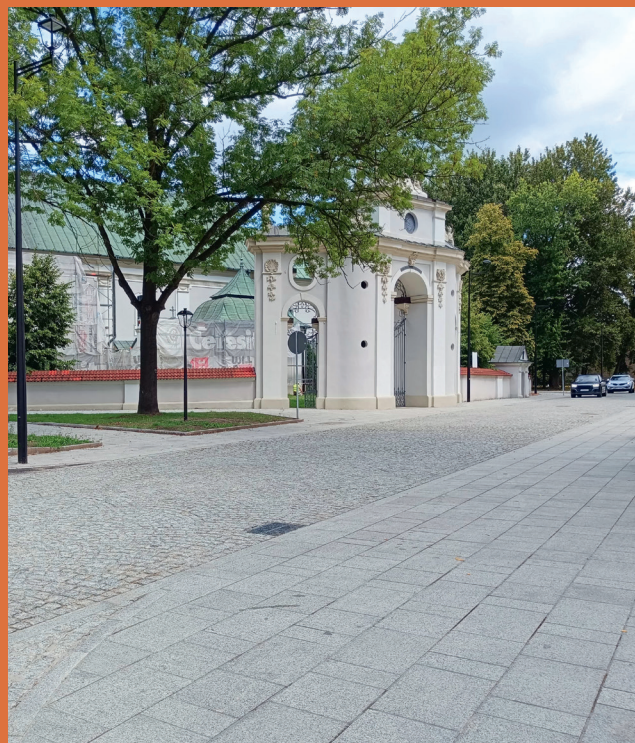
ul. Kościuszki w Siewierzu